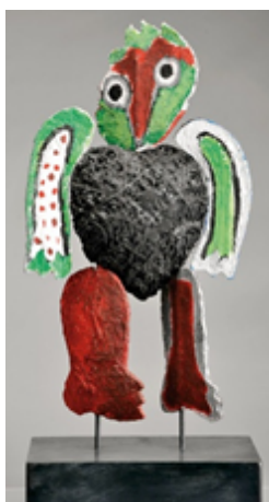
Figura 2 – José de Guimarães, Camões , 1990, diversos materiais, 70 cm In www.cml.pt (consultado em janeiro de 2022)