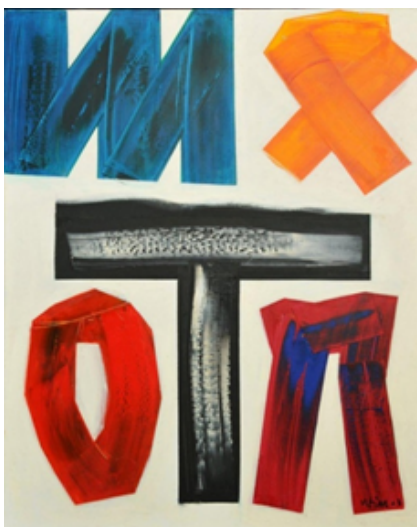
Figura 1 – João Vieira, Sem título , 2003, óleo sobre tela, 100 cm x 81 cm

Nas Figuras 1, 2 e 3, podes observar três exemplos de criações realizadas por artistas que usaram diversas técnicas e diferentes materiais para representar uma ideia.