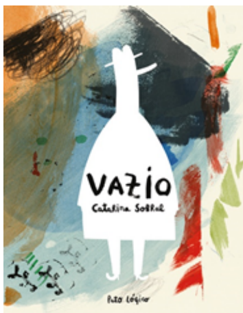
Figura 3 – Catarina Sobral, Vazio (capa de um livro), 2014, desenho digital In www.catarinasobral.com (consultado em janeiro de 2022)