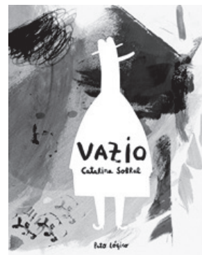
Figura 3 – Catarina Sobral, Vazio (capa de um livro), 2014, desenho digital In www.catarinasobral.com (consultado em janeiro de 2022)

O Carapé é um livro muito especial. Vive numa biblioteca mágica, protegido pela Soneca, um morcego amigos dos livros.