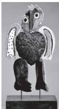
Figura 2 – José de Guimarães, Camões , 1990, diversos materiais, 70 cm