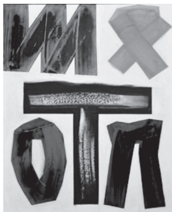
Figura 1 – João Vieira, Sem título , 2003, óleo sobre tela, 100 cm x 81 cm In www.saomamede.com (consultado em janeiro de 2022)

Nas Figuras 1, 2 e 3, podes observar três exemplos de criações realizadas por artistas que usaram diversas técnicas e diferentes materiais para representar uma ideia.